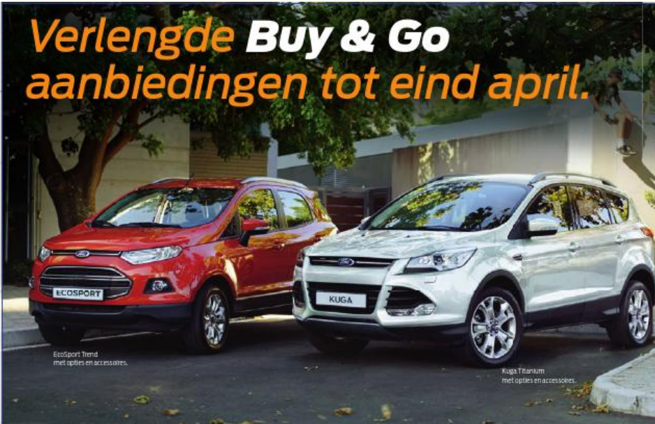
EcoSport Trend met opties en accessoires.